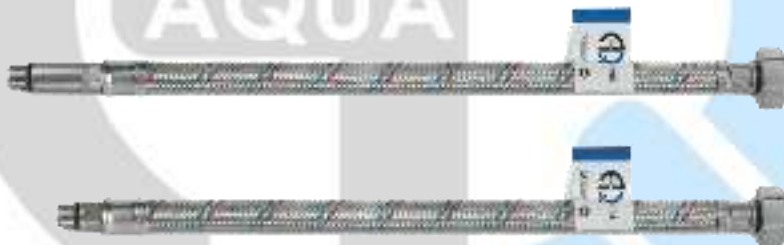
F1/2" x M10x1 (17 мм/ 45 мм)